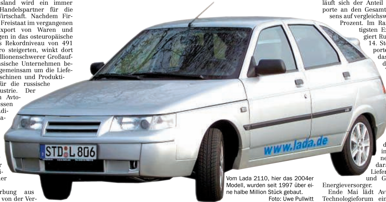
Vom Lada 2110, hier das 2004er Modell, wurden seit 1997 über eine halbe Million Stück gebaut.

Experten gehen davon aus, dass 600 sächsische Betriebe intensive Handelskontakte nach Russland unterhalten. Tendenz steigend. 2006 erhöhten sich die Ausfuhren im Vorjahresvergleich